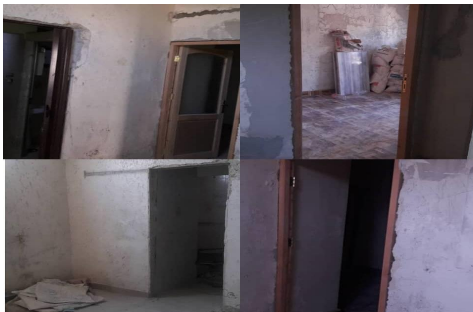
Stan przed remontem