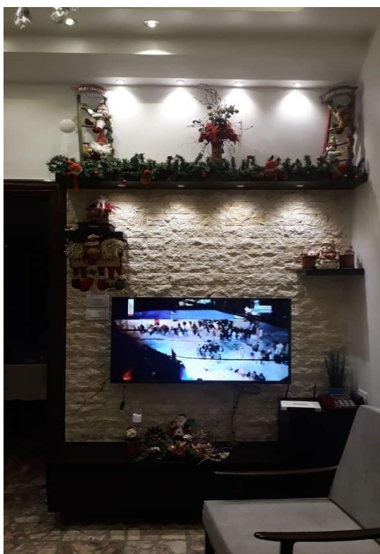
Stan po remoncie